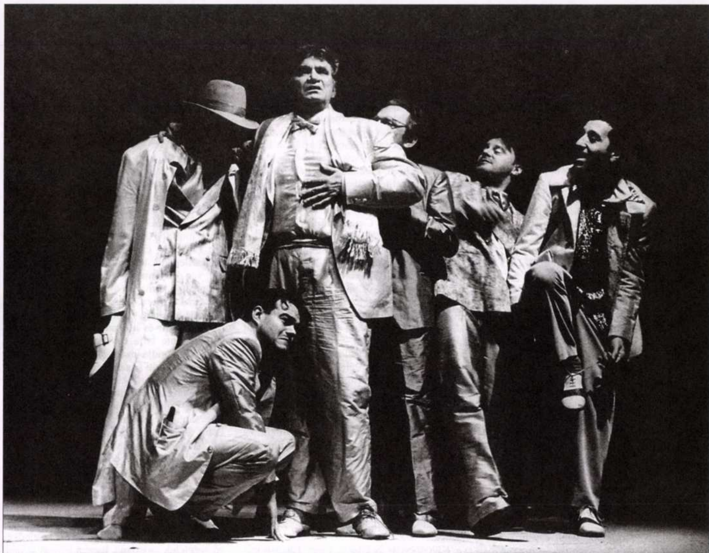
Alonzo és udvartartása a Katona József Színház előadásában (a cikk többi képe is e produkcióból való)